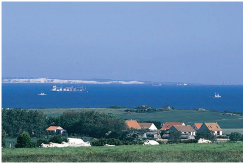
Vue sur le Déroit