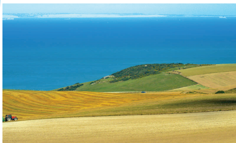
Vue du Mont de Couple vers les Côtes Anglaises...

Autour des thématiques de la mer, du littoral et des zones côtières sur le territoire Manche—Mer du Nord